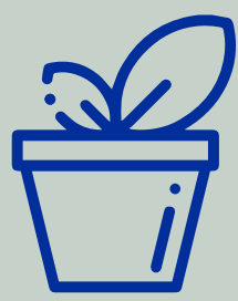
Recipientes de barro o jardineras